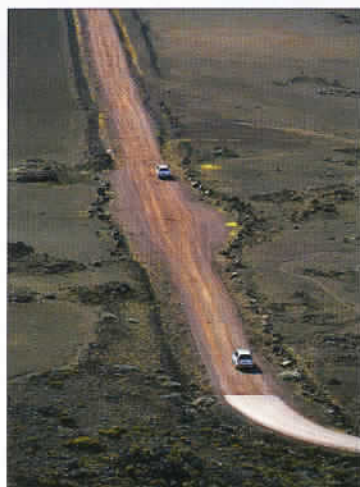
Image souvenir d'une belle journée sur les pistes, partagée avec l'équipe de Kréolie 4x4.

Assurément mon vol en hélicoptère le plus intense. Pour se remettre de ces émotions, je vous conseille une visite de la Saga du rhum, un musée installé dans la plus ancienne distillerie de la Réunion. Tout à fait instructif avec dégustation à la clé. Personnellement, j'ai craqué pour un rhum arrangé à la vanille Vangassaye. Une exquise libation ! La prochaine étape, à l'hôtel Floralys de L'Etang Salé les Bains permet de se baigner dans l'océan et autorise, en outre, deux superbes excursions en 4x4 : l'ascension du Dimitile par la piste à travers une superbe forêt, et par ailleurs une virée montagnarde sur asphalté au Cirque de Cilaos. Que du bonheur ! Après, chemin faisant vers Saint-Gilles, deux nouvelles visites sont possibles. La première au Conservatoire Botanique de Mascarin à Saint-Leu, une approche scientifique et