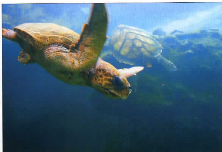
Les tortues marines du centre Kélonia. Un centre d'observation qui ravira d'abord les enfants.