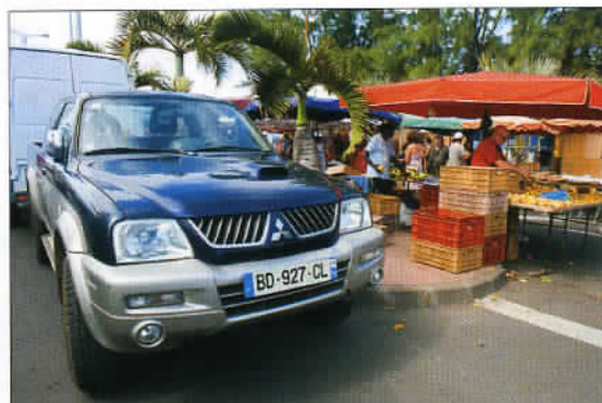
Le marché de Saint-Pierre, une visite incontournable afin de goûter les différentes saveurs de l'île : africaines, européennes, hindoues, indo-musulmanes, malgaches... Un tout qui donne le Créole !