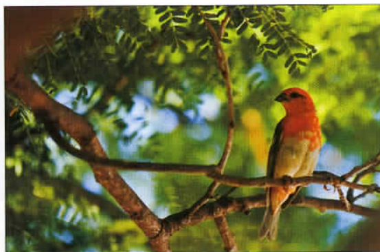
Un oiseau Cardinal sur l'ancienne île Bourbon, un nom en hommage à Louis XIII du temps du cardinal de Richelieu... La Réunion connaît quelques espèces protégées.