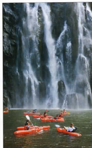
La cascade Niagara près de Sainte-Suzanne. De nombreuses activités sportives sont pratiquées à la Réunion.