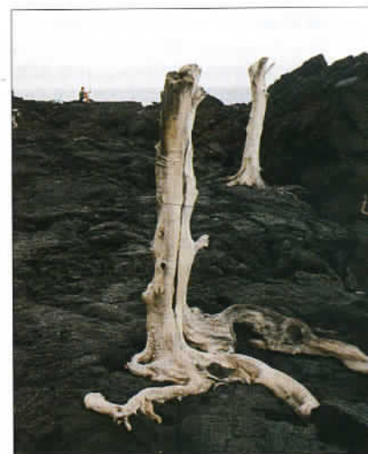
Le Cap Méchant entre Saint-Philippe et Saint-Joseph.